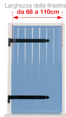
Una tapparella a 1 anta singola sinistra , peso massimo 30 kg