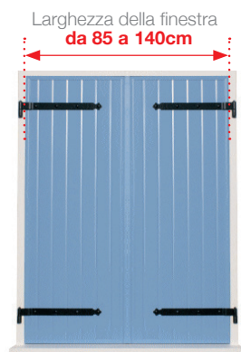
Una tapparella a 2 battenti , peso massimo 30 kg per battente