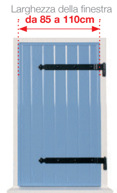
Una tapparella a 1 anta singola destra , peso massimo 30 kg